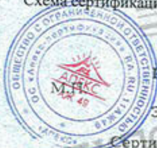
Схема сертификации: Ic.